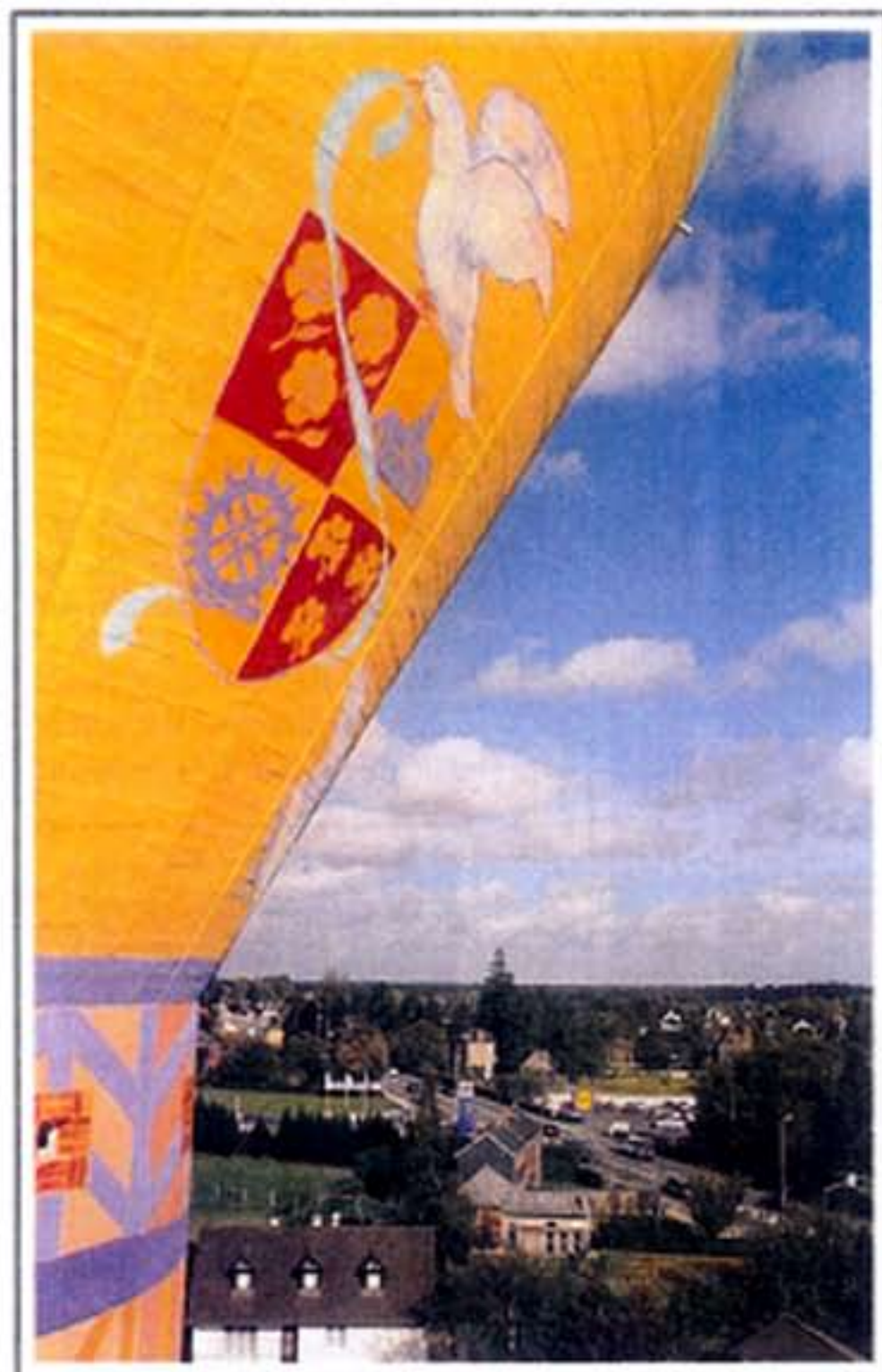
Photo prise depuis la nacelle en direction de la mairie

Sur le réservoir, 3 armoiries de la ville et 3 lucarnes à auvent traditionnelles dans l'architecture locale. Elles donnent sur un paysage différent : au lever du soleil, au zénith, (on aperçoit les Côtes Normandes) et au soleil couchant. L'envolée de colombes symbolise la paix. Elles tiennent dans leur bec des rubans colorés rappelant l'ancienne activité économique locale : rubanerie, draperie.